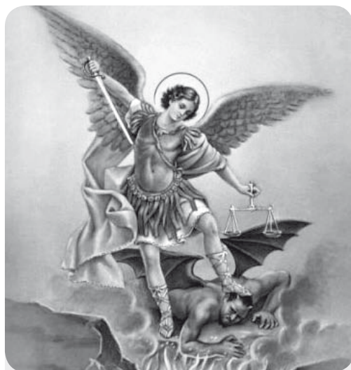
São Miguel Arcanjo

Saiba mais sobre Miguel, Gabriel e Rafael