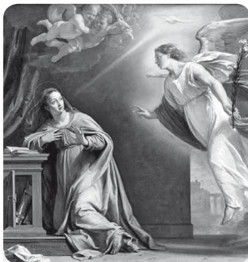
São Gabriel Arcanjo