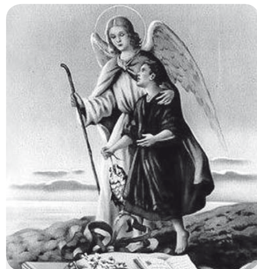
São Rafael Arcanjo