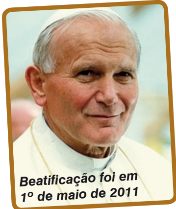
Beatificação foi em 1º de maio de 2011