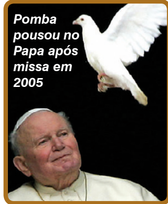
Pomba pousou no Papa após missa em 2005