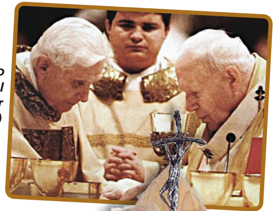
Celebrando com Cardeal Ratzinger (Bento XVI)