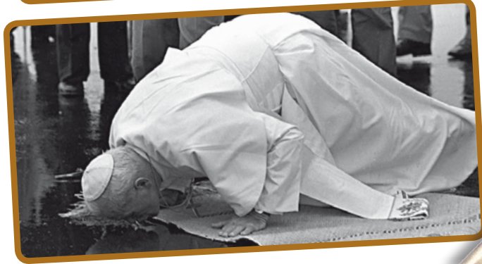
Sempre beijava o solo ao descer do avião