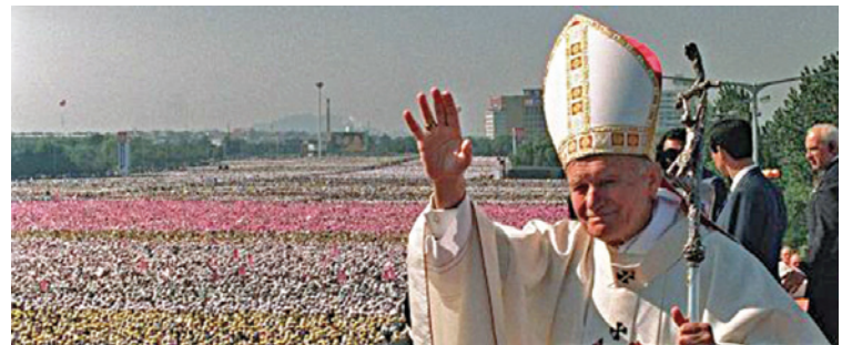
Na visita ao País em 1991

A terceira viagem ao Brasil foi no 2º Encontro Mundial do Santo Padre