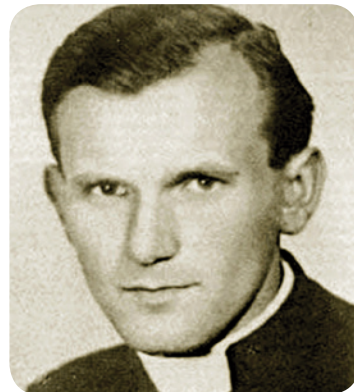
Foi ordenado padre em 1946

Durante seu papado, promoveu aproximação a outras religiões monoteístas, motivando o diálogo inter-religioso, o ecumenismo e a cultura da paz. Foi o primeiro Papa a pregar em uma igreja luterana e em uma mesquita, bem como a visitar o Muro das