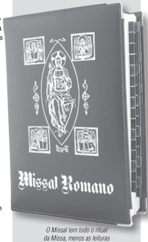
O Missal tem todo o ritual da Missa, menos as leituras