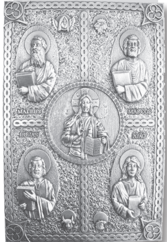
O Evangelário é usado em missas dominicais e solenidades

Livros para celebração dos sacramentos em sua teologia, espiritualidade, pastoral e suas normas práticas, além da leitura correspondente a cada sacramento.