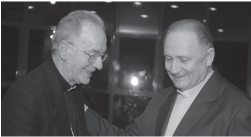
Dom Cláudio (esq) recebe abraço de Dom Nelson pelos 50 anos de sacerdócio

Aniversário Sacerdotal: Em 02 de agosto, toda a Diocese de Santo André se reuniu na Catedral do Carmo para celebrar os 50 anos de sacerdócio do Cardeal Dom Cláudio Hummes, que foi o segundo bispo da Diocese. Devido a atrasos no transporte aéreo, infelizmente não pudemos contar com a presença de Dom Cláudio nesta data. Porém, todo o povo rezou e agradeceu a Deus por sua vida dedicada ao próximo e ao reino do céu.