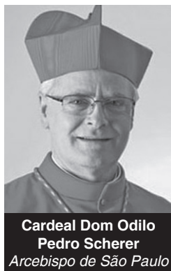
Cardeal Dom Odilo Pedro Scherer Arcebispo de São Paulo

Para obter o álbum completo de fotos do Jubileu de Dom Cláudio ou dos 50 anos de Dedicção da Catedral, procure a Foto Paino. Telefone: (11) 4990-7008