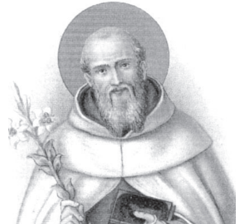
São Simão Stock

Terminada esta prece, levantou os olhos marejados e viu a cela encher-se de luz. Rodeada de anjos, apareceu-lhe a Virgem Santíssima, revestida de esplendor, trazendo