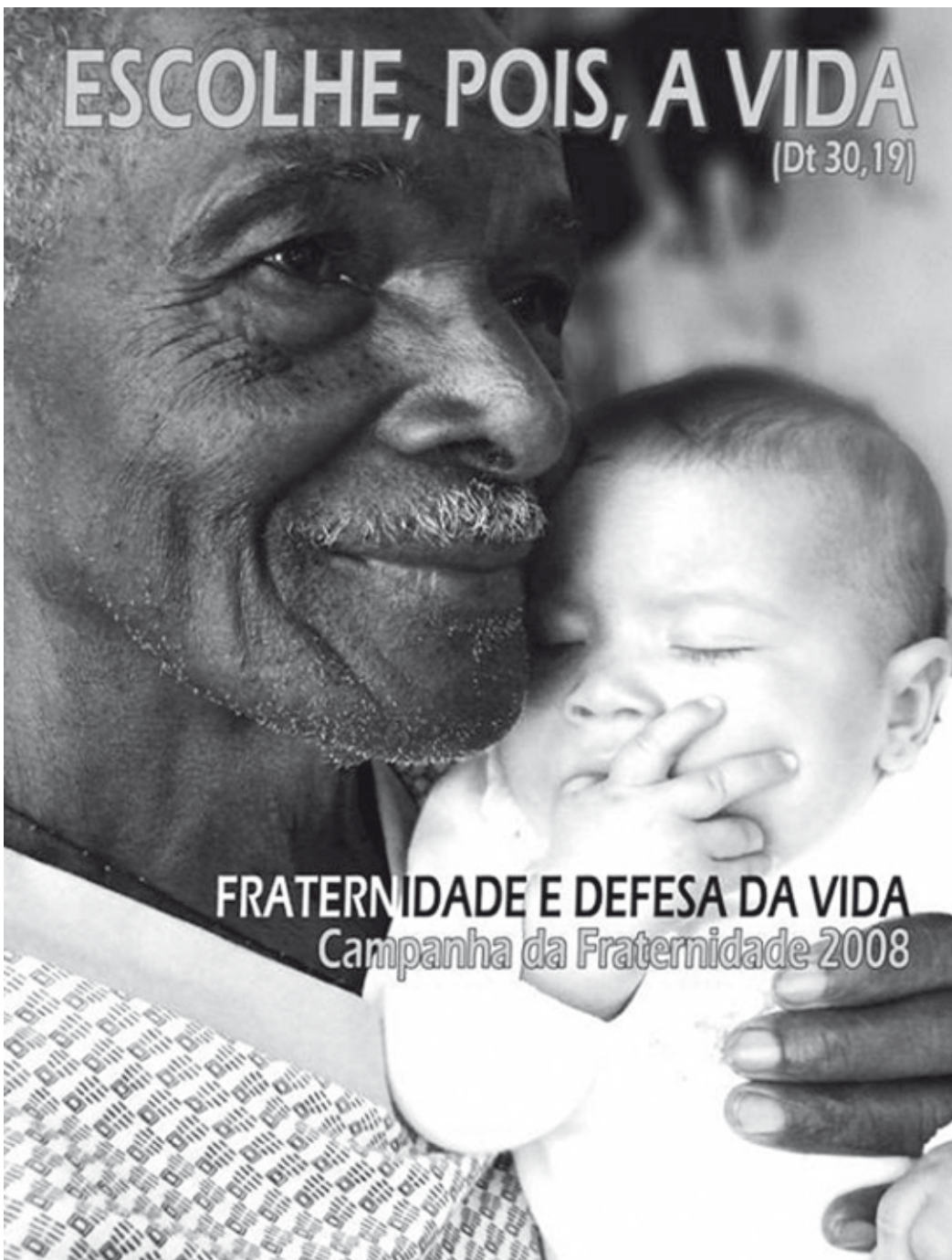
Cartaz da Campanha da Fraternidade 2008

“Escolhe, pois a Vida” é o lema da Campanha da Fraternidade de 2008, proposto pela Conferência Nacional dos Bispos do Brasil (CNBB) para a reflexão durante o tempo litúrgico da Quaresma, à luz da Paixão, da Morte e da Ressurreição de Jesus. Anualmente, a CNBB estuda algum aspecto social brasileiro e o coloca diante da Igreja como objeto de análise e oração em busca de uma mudança de comportamento da sociedade. A partir de 6 de fevereiro, Quarta-feira de Cinzas, início da Quaresma, a Igreja volta seu olhar e suas atitudes especialmente para o tema “Fraternidade e Defesa da Vida”.