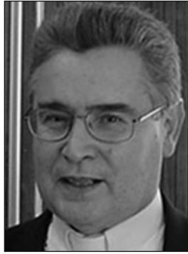
Dom Manuel, novo bispo de São Miguel Paulista, já foi pároco da Catedral

O Papa nomeou Dom Manuel Parrado Carral como novo bispo da Diocese de São Miguel Paulista (que fica na Zona Leste da capital), após a renúncia de Dom Fernando Legal, por razões de idade. Até o momento ele era bispo auxiliar de São Paulo desde 2001, responsável pela Região Sé. Dom Manuel também já foi pároco da Catedral entre janeiro de 1999 e fevereiro de 2001. Ele nasceu em San Roman, na Espanha, e veio para o Brasil com os pais quando tinha 11 anos. Viveu em São Caetano do Sul e foi ordenado sacerdote em nossa diocese em 1972.