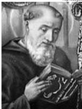
Imagem de São Bento