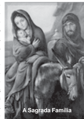
A Sagrada Família

ra o matar.” Levantando-se de noite, ele tomou o menino e a mãe, e partiu para o Egito”. (Mt 2,13-14).