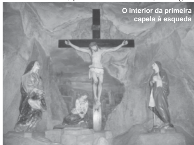
O interior da primeira capela à esquerda

Convidamos a todos a contemplar Gólgota não como um lugar de dor e sofrimento, mas sim como um símbolo da vida nova em Cristo ressuscitado na Páscoa. ■