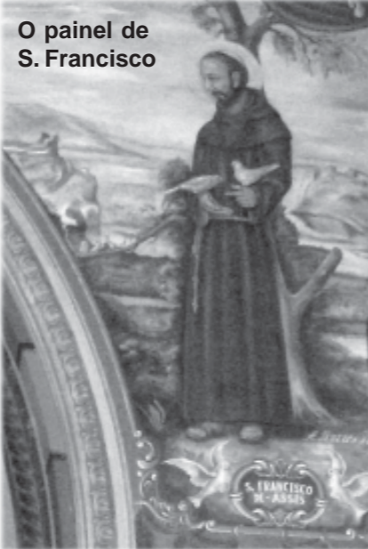
O painel de S. Francisco

Somente após compreender que a Igreja que devia restaurar não era a de pedra, mas a própria Igreja de Cristo, enfraquecida na época pelas divisões, heresias e pelo apego de seus líderes às riquezas e ao poder, Francisco reconhece claramente a sua vocação de missionário do Evangelho de Cristo. Saiba mais sobre a vida e obra de São Francisco de Assis acessando: http://www.franciscanos.org.br e http://www.ffb.org.br ■