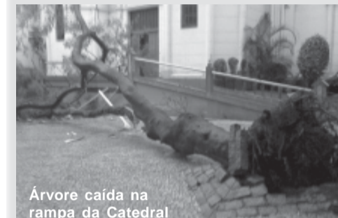
Árvore caída na rampa da Catedral