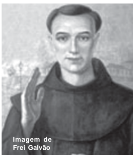
Imagem de Frei Galvão