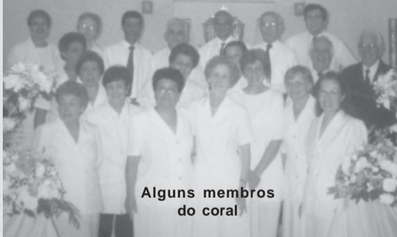
Alguns membros do coral

A expectativa é de que a canonização de Frei Galvão seja oficializada em maio de 2007, durante a visita do Papa ao Brasil. ■