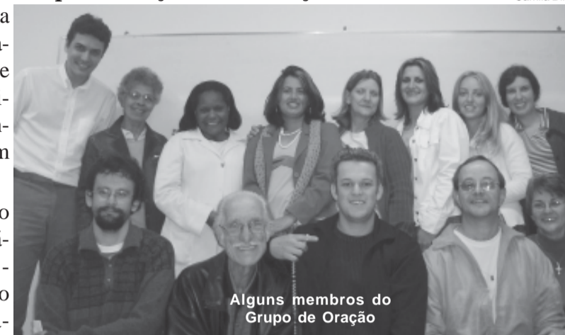
Alguns membros do Grupo de Oração

Em todas as épocas e em todos os povos, os homens procuram Deus. Procuram para aprender d'Ele a compreenderem-se e a compreender o mundo.