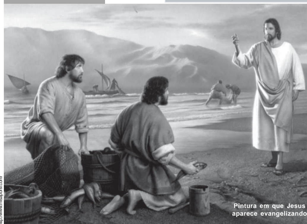
Pintura em que Jesus aparece evangelizando