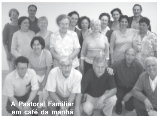
A Pastoral Familiar em café da manhã

Durante das reuniões, o grupo segue um roteiro de um diretório produzido pela CNBB preparado especialmente para a Pastoral Familiar. Também seguem alguns subsídios. São feitas reflexões sobre o evangelho e outros textos. O grupo também se reúne em momentos de oração, como novenas e terços nas casas de famílias que residem próximas à Cate-