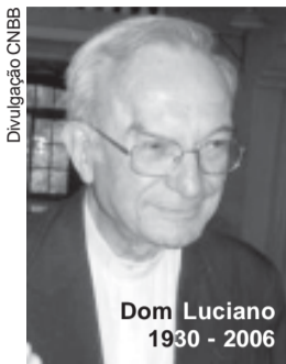
Dom Luciano 1930 - 2006

Texto de Dom Luciano Mendes de Almeida publicado em 05/08/06, na Folha de S. Paulo