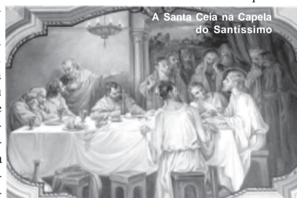
A Santa Ceia na Capela do Santíssimo

João, que está à direita de Jesus, representa todos os que assentaram à direita de