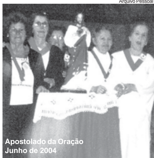
Apostolado da Oração Junho de 2004