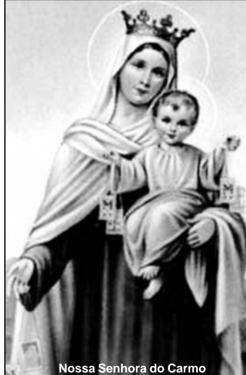
Nossa Senhora do Carmo

Obs.: Em todas as missas do dia 16 de julho haverá a distribuição do escapulário e a venda do tradicional bolo de Nossa Senhora do Carmo