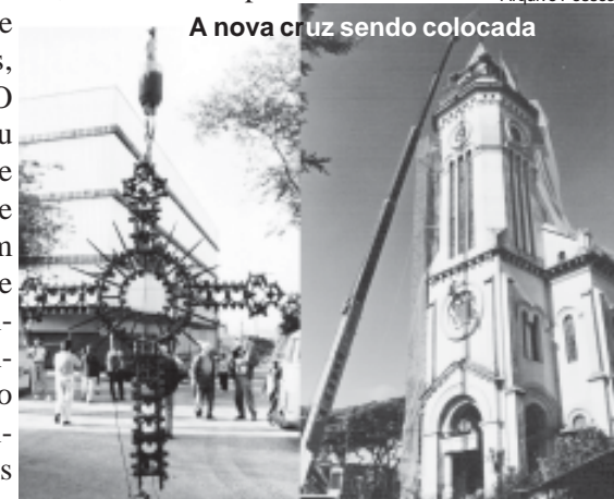
A nova cruz sendo colocada