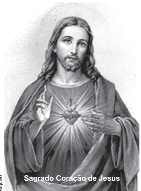
Sagrado Coração de Jesus