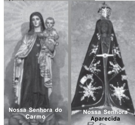
Nossa Senhora do Carmo