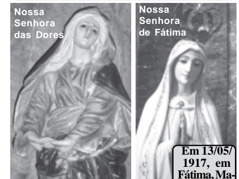
Nossa Senhora das Dores

Maria, ao nascer, tirou dos ombros dos pais o peso de uma vida estéril, e ainda recompensou-os pela fé, ao ser escolhida, no futuro, para ser a Mãe do Filho de Deus