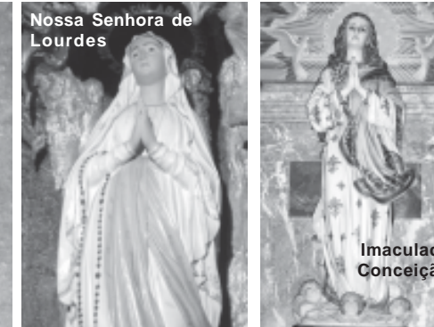
Nossa Senhora de Lourdes

Em 13/05/1917, em Fátima, Maria apareceu a três pastorinhos: "Rezar o terço todo dia, pela paz no mundo e pela conversão dos pecadores"