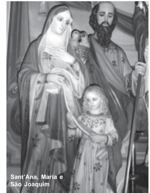
Sant'Ana, Maria e São Joaquim

Maria, ao nascer, tirou dos ombros dos pais o peso de uma vida estéril, e ainda recompensou-os pela fé, ao ser escolhida, no futuro, para ser a Mãe do Filho de Deus