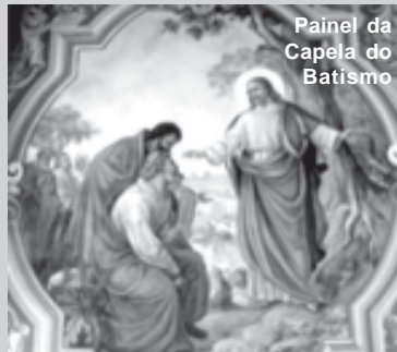
Painel da Capela do Batismo

Batizai em nome do Pai, do Filho e do Espírito Santo